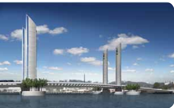
Futur Pont Bacalan-Bastide

Le quartier Bacalan est un des quartiers de Bordeaux qui a connu la plus forte évolution ces dernières années : le nombre de logements a augmenté de plus de 30% en 8 ans.